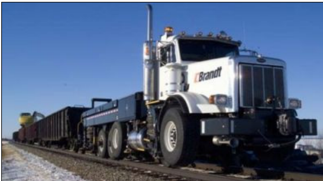
Photo 1. Camion rail-route Brandt

La tranche de wagons a été manœuvrée par un tracteur routier qu'on avait modifié pour le faire rouler sur les rails. Ce camion modifié est connu sous le nom de camion rail-route Brandt (voir la photo 1). Le 3 juillet 2007, le camion Brandt a subi une panne de circuit d'air comprimé, qui a nui à sa capacité de freiner et de réalimenter les systèmes de freinage des wagons.