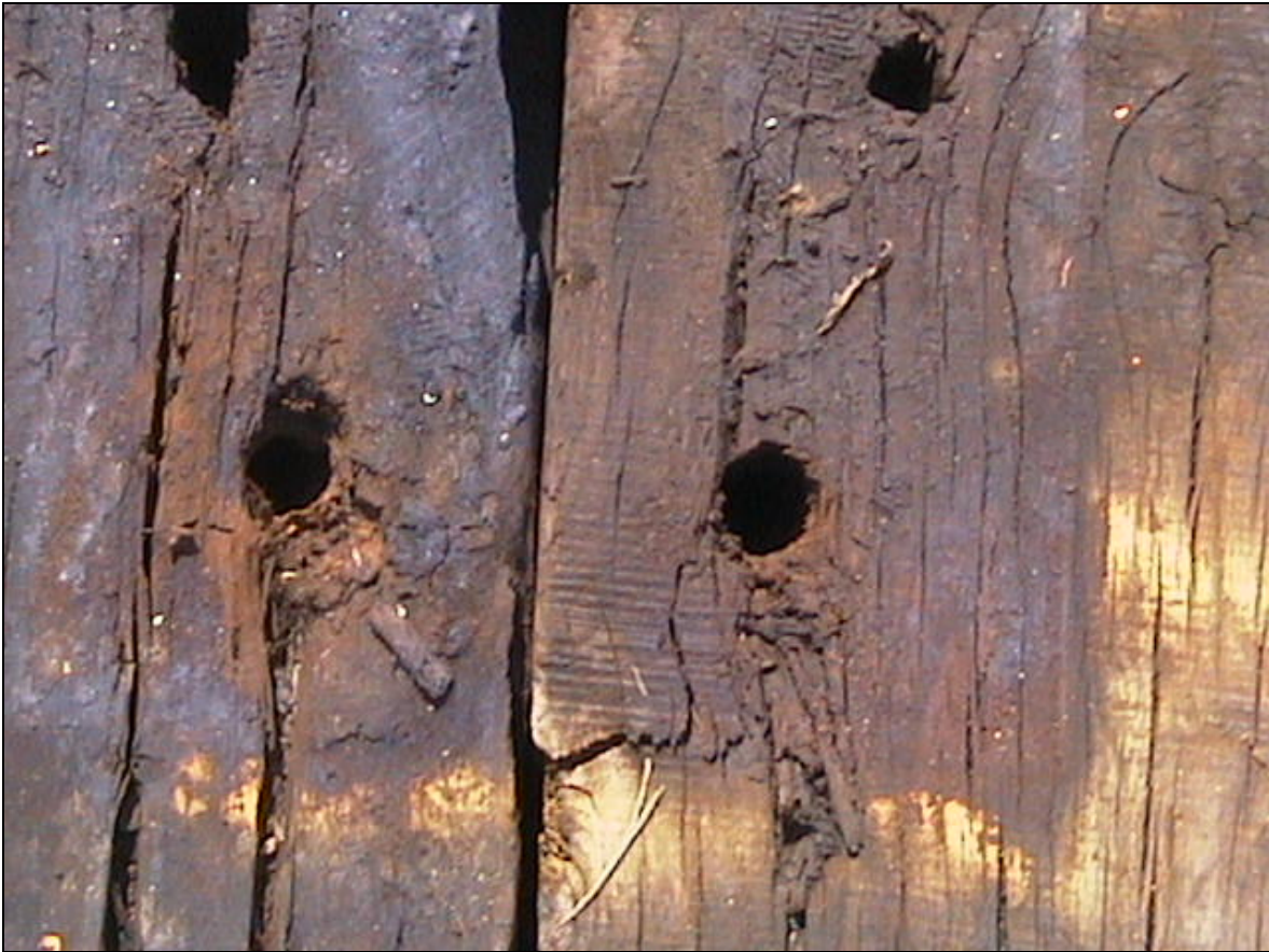
Photo 4. Trous de crampon détériorés dans les traverses

En avril 2007, le CFCP a effectué l'inspection annuelle du triage Smiths Falls. Lors de cette dernière, on n'a relevé aucune défectuosité du dérailleur installé à l'extrémité est du triage Smiths Falls. Toutefois, on a noté que les traverses situées sur les lieux de l'incident étaient vieilles, et que les trous de crampon s'étaient détériorés (voir la photo 4). On a également signalé, lors de l'inspection, que les traverses devraient être remplacées à cet endroit. Par contre, elles n'ont pas été remplacées avant l'évènement.