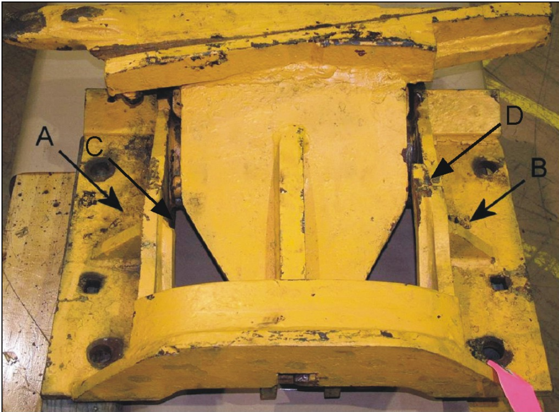
Photo 3. Dérailleur coulissant installé à l'extrémité est du triage Smiths Falls

Dans le cadre de l'analyse en laboratoire, on a également examiné un autre dérailleur n°6 installé dans le triage Smiths Falls. À l'endroit où ce dérailleur était installé, les traverses étaient fendues vis-à-vis de certains trous de crampon et les attaches de rail n'étaient pas logées complètement dans les assises. Le boîtier du dérailleur n'était pas posé à plat sur les traverses. Il