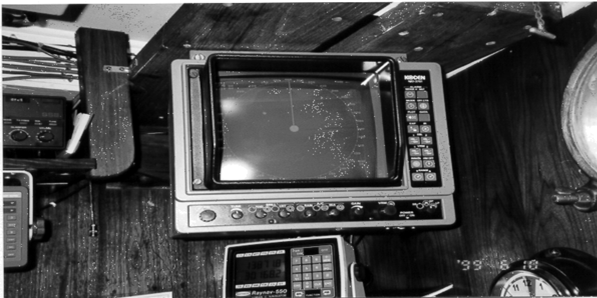
Affichage radar dans la salle des cartes—invisible du poste de commande de la manoeuvre.