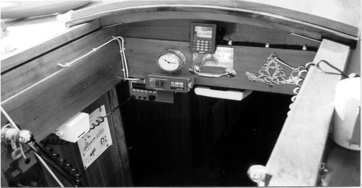
Indicateur de l'échosondeur (sous l'horloge), avec des instructions disant d'ajouter 10 (pieds). Sondages indiqués en pieds.