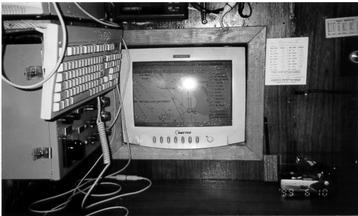
Affichage de la carte électronique—invisible du poste de commande de la manoeuvre.