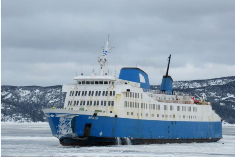
Figure 1. L' Apollo