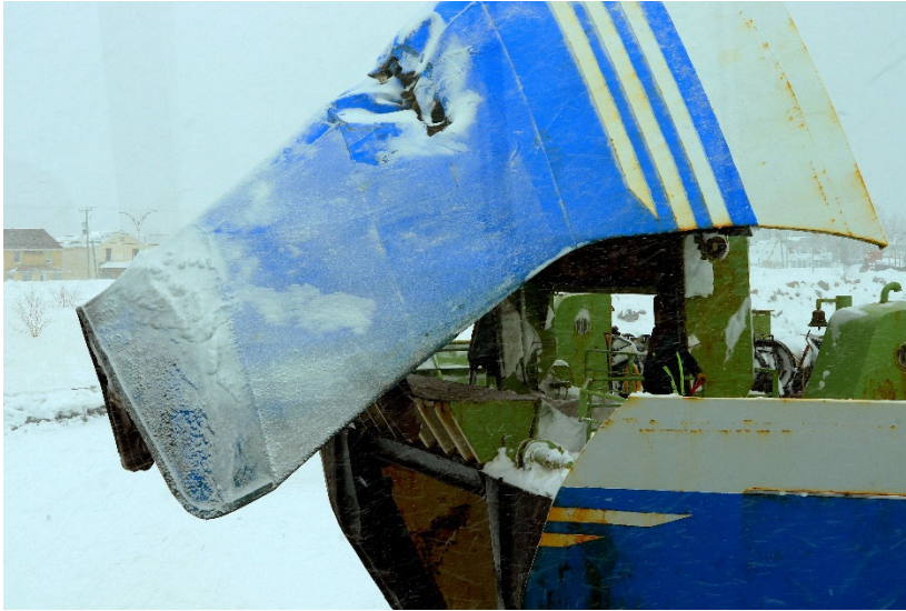
Figure 3. Dommages à la visière d'étrave de l' Apollo

Vers 15 h, 2 inspecteurs de la sécurité maritime de Transports Canada ont inspecté l' Apollo . Après l'inspection, le navire a été autorisé à se rendre à Matane pour y subir des réparations. À 16 h, l' Apollo a quitté Godbout sans passagers à bord et escorté par le navire de la Garde côtière canadienne Des Groseilliers . L' Apollo est arrivé à Matane à 19 h 30.