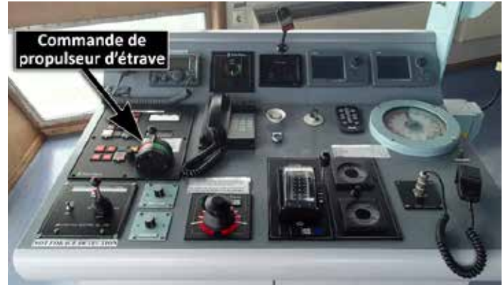
Figure 2. Poste de conduite bâbord montrant l'emplacement de la commande de propulseur d'étrave

À 18 h 09, le capitaine a coupé l'alimentation du propulseur d'étrave et a remarqué une brève fluctuation de l'indicateur de charge du propulseur d'étrave. Le capitaine a redémarré le propulseur d'étrave afin de vérifier ce qu'il venait d'observer. Au même moment, les membres d'équipage qui se trouvaient sur le gaillard ont entendu un bruit fort et les membres d'équipage qui se trouvaient dans la salle des machines ont senti des vibrations.