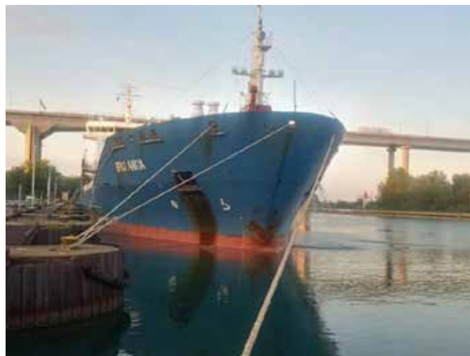
Figure 1. Le Bro Anna

La passerelle est dotée de 2 radiotéléphones très haute fréquence (VHF), 1 système électronique de visualisation de cartes électroniques et d'information (ECDIS), 2 radars, et 3 postes de conduite : 1 au milieu du navire, 1 à bâbord et 1 à tribord. Les postes de