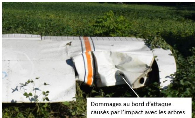
Figure 2. Photo des dommages à l'aile gauche

Les bords d'attaque des 2 ailes présentaient des signes caractéristiques d'un impact avec les arbres, le plus important se trouvant sur le bord d'attaque extérieur de l'aile gauche, à environ 2 pieds de l'extrémité de l'aile (figure 2).