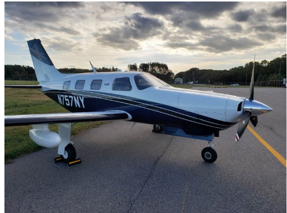
Figure 2. Avion à l'étude dans une photo non datée (Source : Norfolk Aviation)

L'avion transportait une ELT de 406 MHz qui s'est déclenchée à la suite de l'impact et qui a transmis le signal de détresse initial au JRCC.