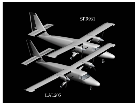
Figure 2. Orientation des avions au moment de l'impact.

Natuashish que LAL205 a pour la première fois aperçu SPR961, lorsque le commandant de bord de ce dernier l'a contacté par radio. SPR961 a remarqué LAL205 juste avant la collision (voir la Figure 2). Le copilote a alors exécuté une montée, après quoi le commandant de bord a pris les commandes et amorcé un virage d'évitement à gauche afin de s'éloigner de LAL205.