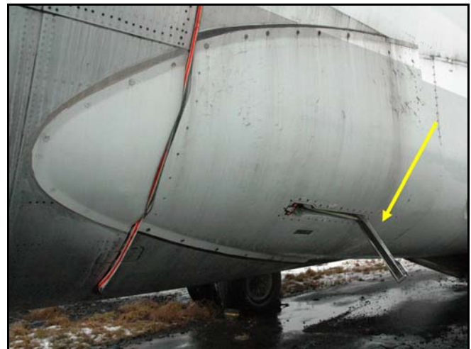
Photo 3. Porte de soute arrière fermée et non verrouillée

Lorsque la porte de soute est ouverte, la poignée est sortie vers l'extérieur à environ 90 degrés, dans l'écoulement aérodynamique (voir la photo 3). Boeing et le National Transportation Safety Board des États-Unis avaient déjà examiné la poignée extérieure de porte de soute à la suite d'un incident semblable. L'analyse avait permis de conclure que, à une vitesse de 190 nœuds, la force aérodynamique poussait la poignée assez loin pour que la tension du ressort intérieur de la porte de soute rentre complètement la poignée, même si la porte de soute demeurait ouverte. Durant le vol en question, l'avion a atteint une vitesse indiquée maximale de plus de 250 nœuds.