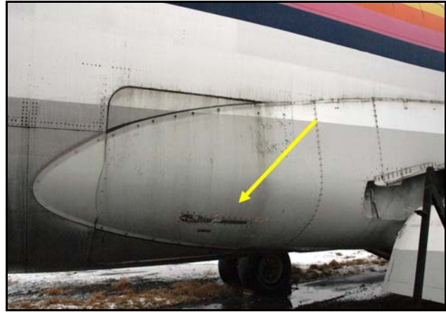
Photo 2. Poignée de la porte de soute arrière rentrée

Pour verrouiller la porte, il faut d'abord pousser la porte de soute contre le cadre de porte tout en maintenant la poignée extérieure complètement sortie. Une fois la porte complètement fermée, les rouleaux du verrou sont alignés avec leur came respective. Le mouvement ou le retrait de la poignée engage les rouleaux de verrouillage à arc-boutement dans leur came respective, ce qui verrouille la porte tout en la poussant vers l'intérieur et vers le bas. La poignée de porte peut alors être rentrée dans son logement (voir la photo 2).